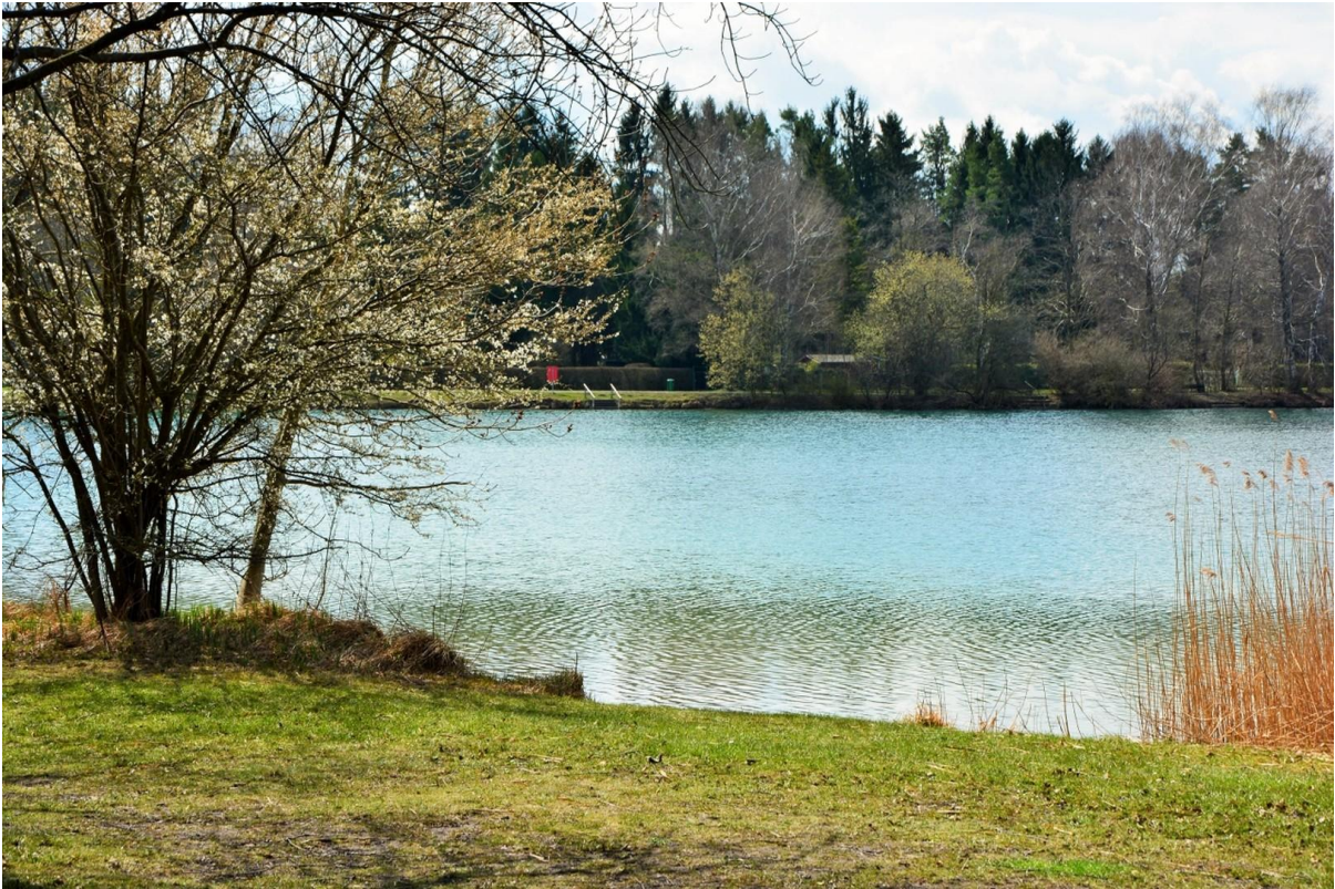
Spazieren und Baden am See