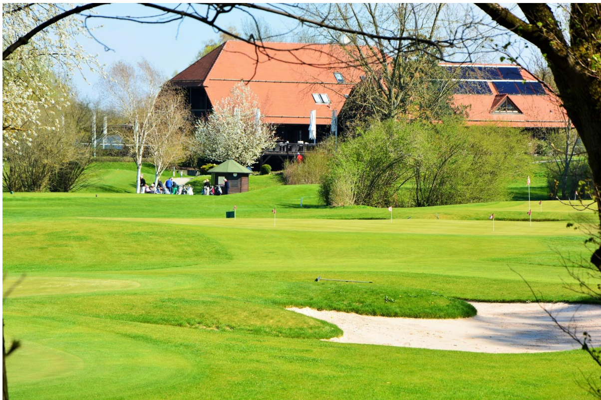
Golfplatz & Minigolf