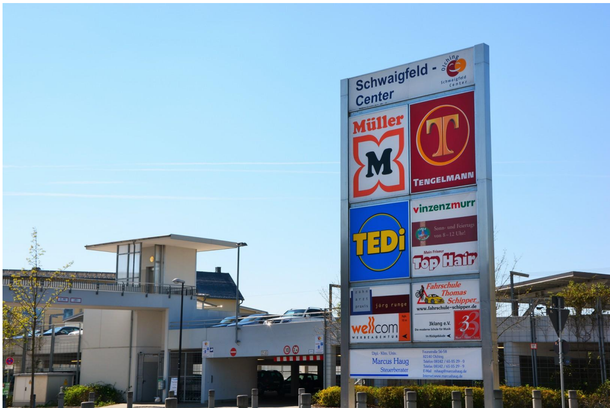
Einkaufsmöglichkeiten zu Fuß