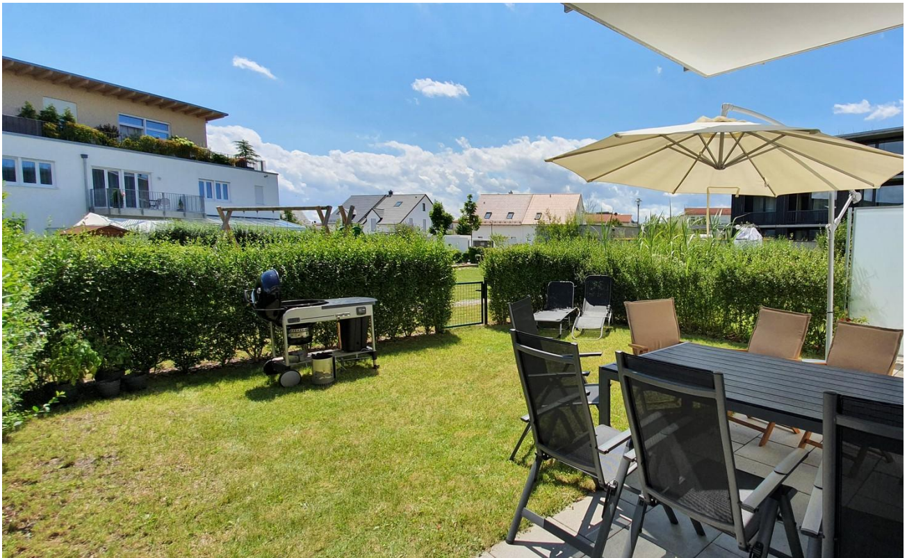
Sonne Morgens bis Nachmittags