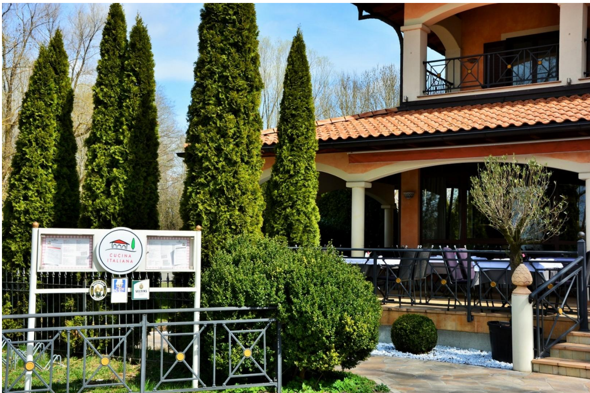
Restaurant am See