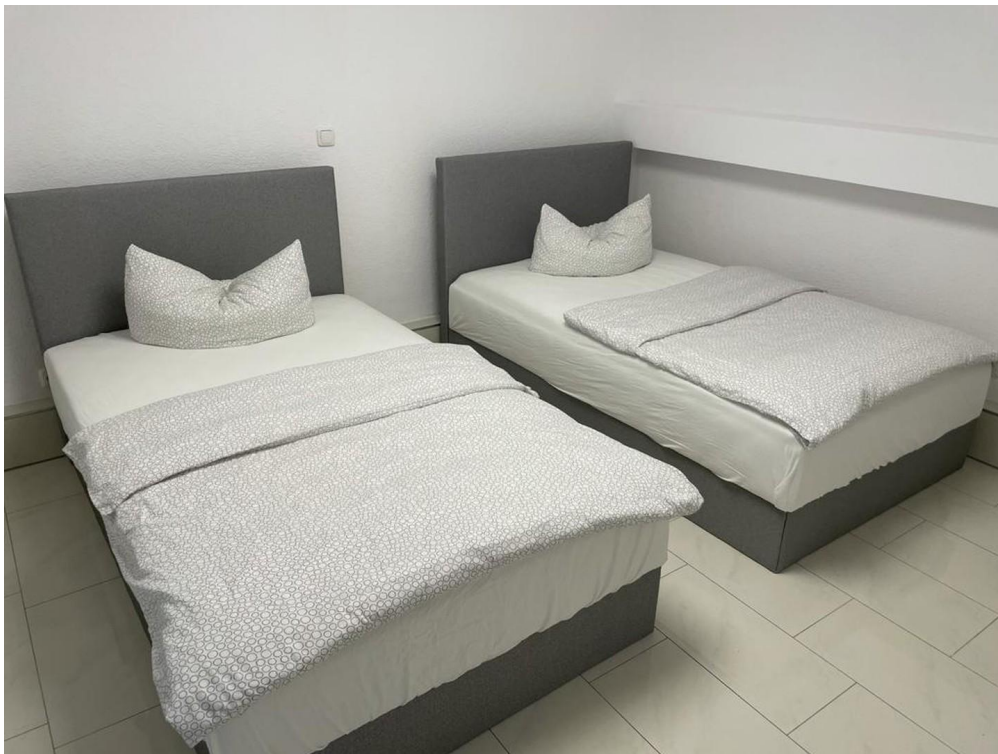
UG " Einzelbetten