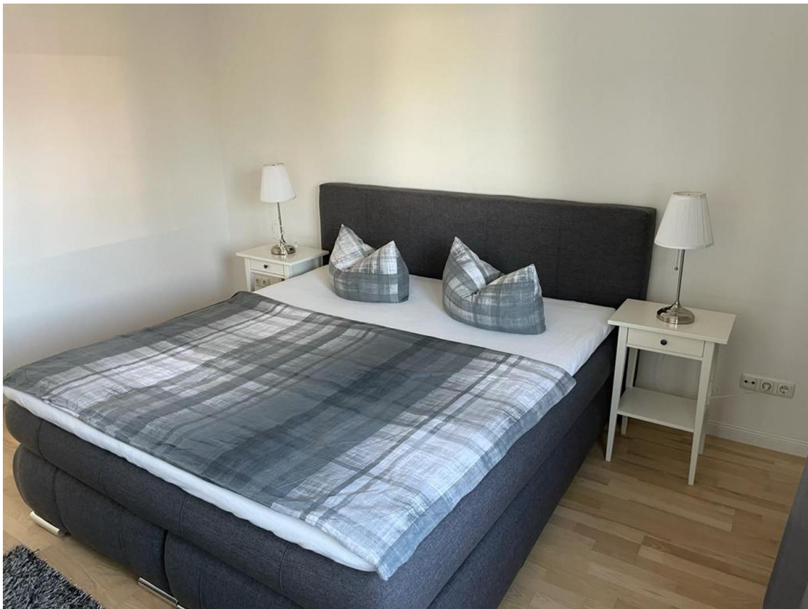
1 OG Doppelbett