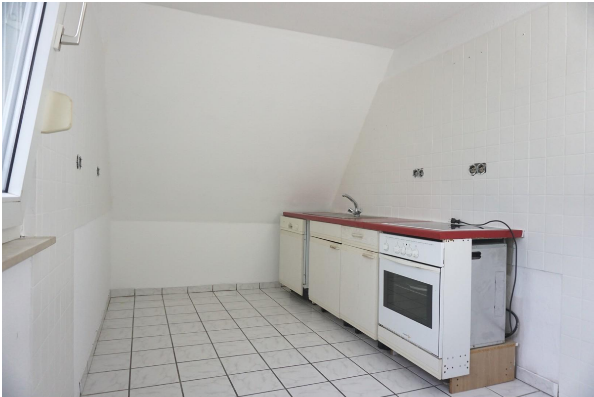
Küche, derzeit ohne Schränke