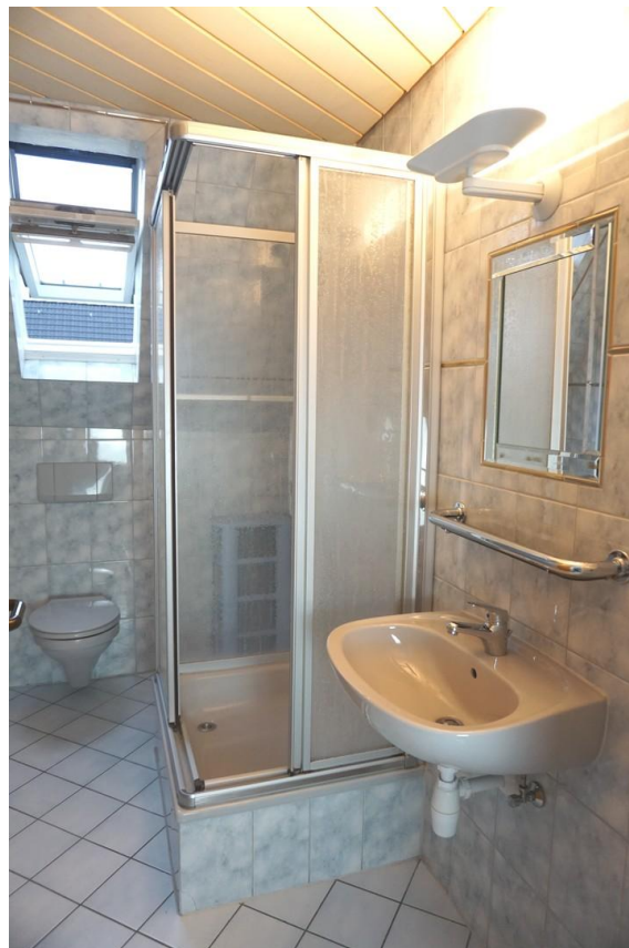
Bad, mit neuer Duschkabine, WC