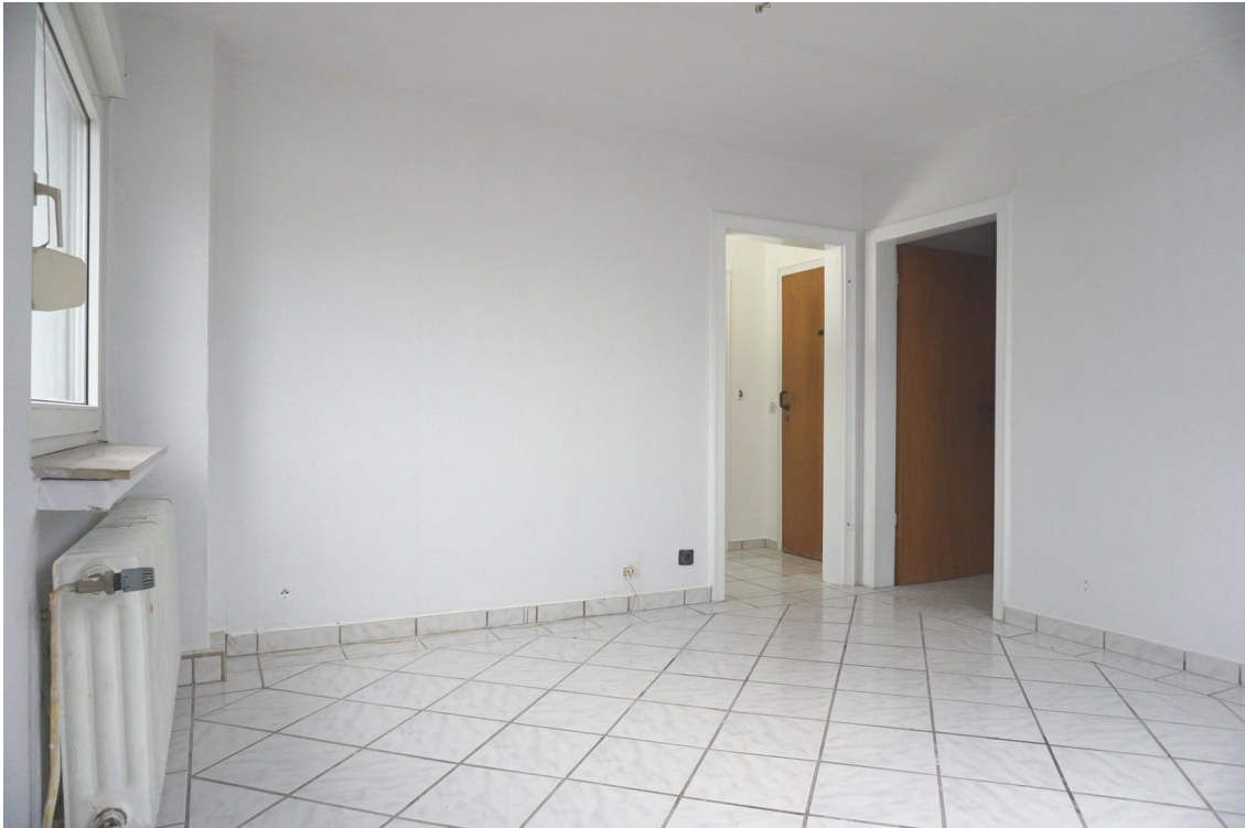
Wohnraum zu den Durchgängen