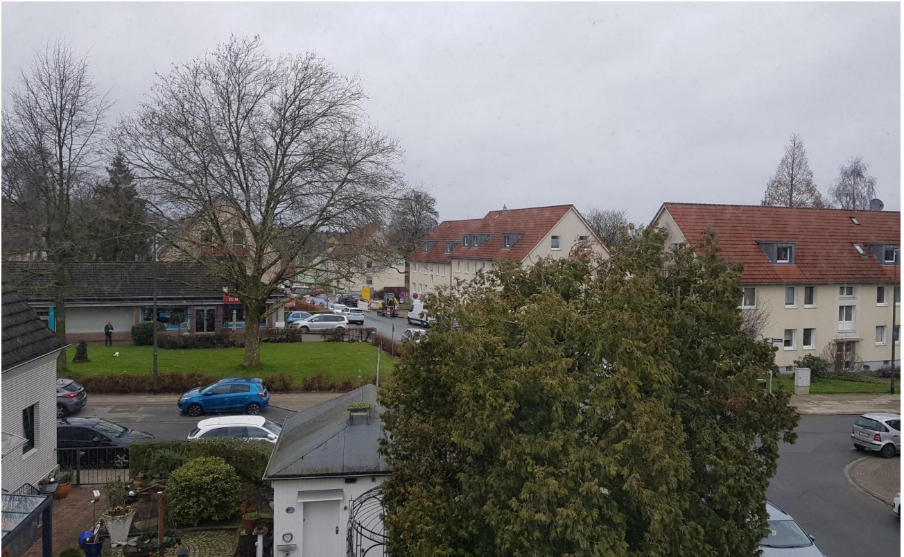
Sicht aus dem Küchenfenster