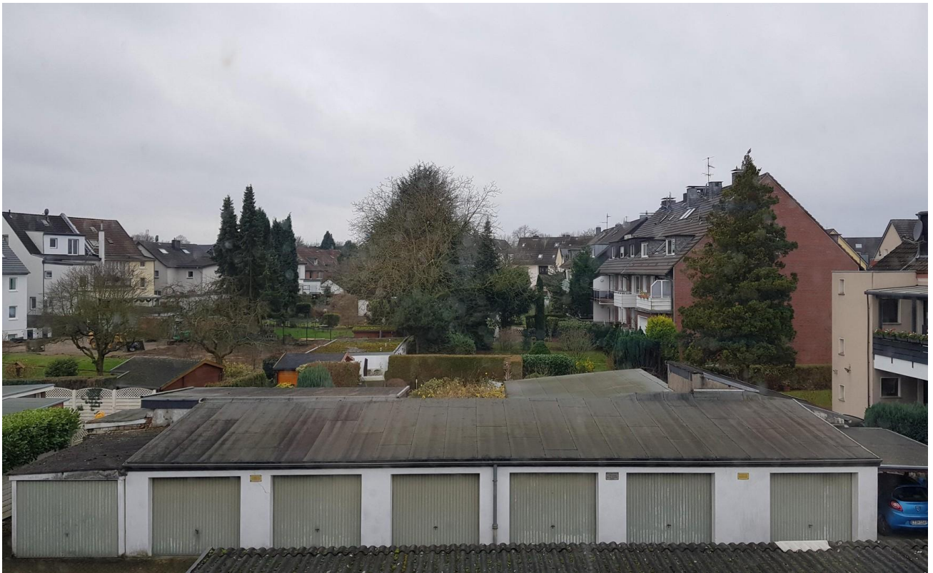
Sicht vom Schlafzimmerfenster