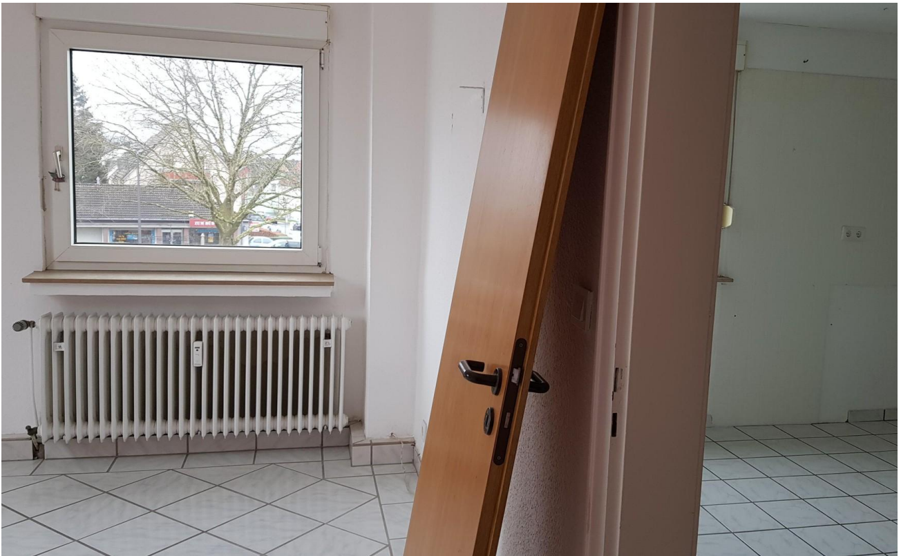
Wohnzimmer, mit Fenster