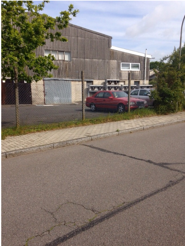
Freifläche und Einfahrt