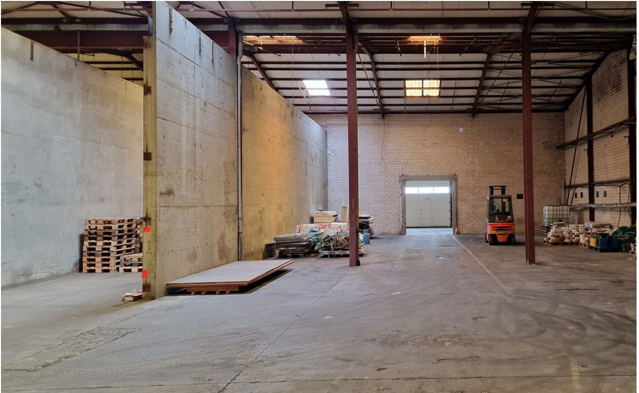
Halle B 2800 qm Innen 5