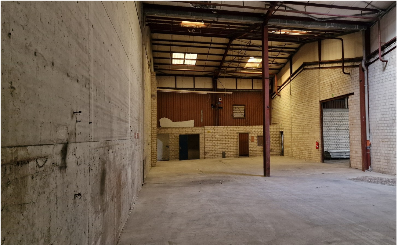
Halle B 2800 qm Innen 3