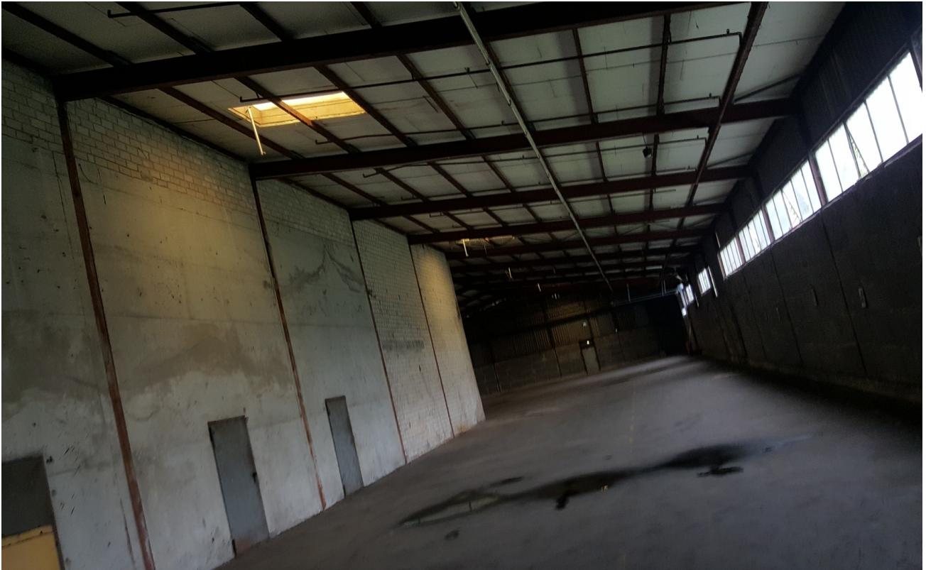
Halle B 2800 qm Innen 1