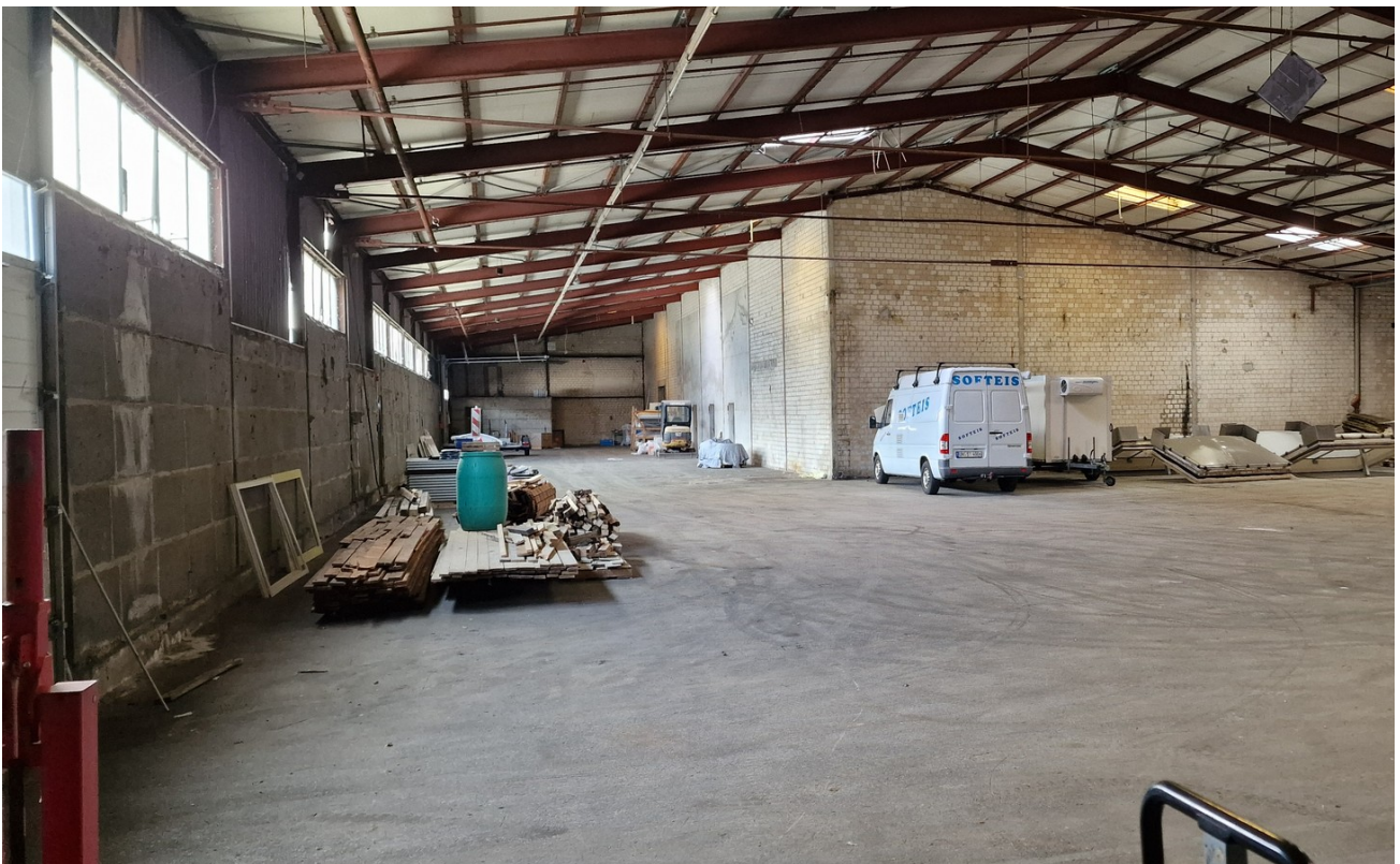
Halle B 2800 qm Innen 8