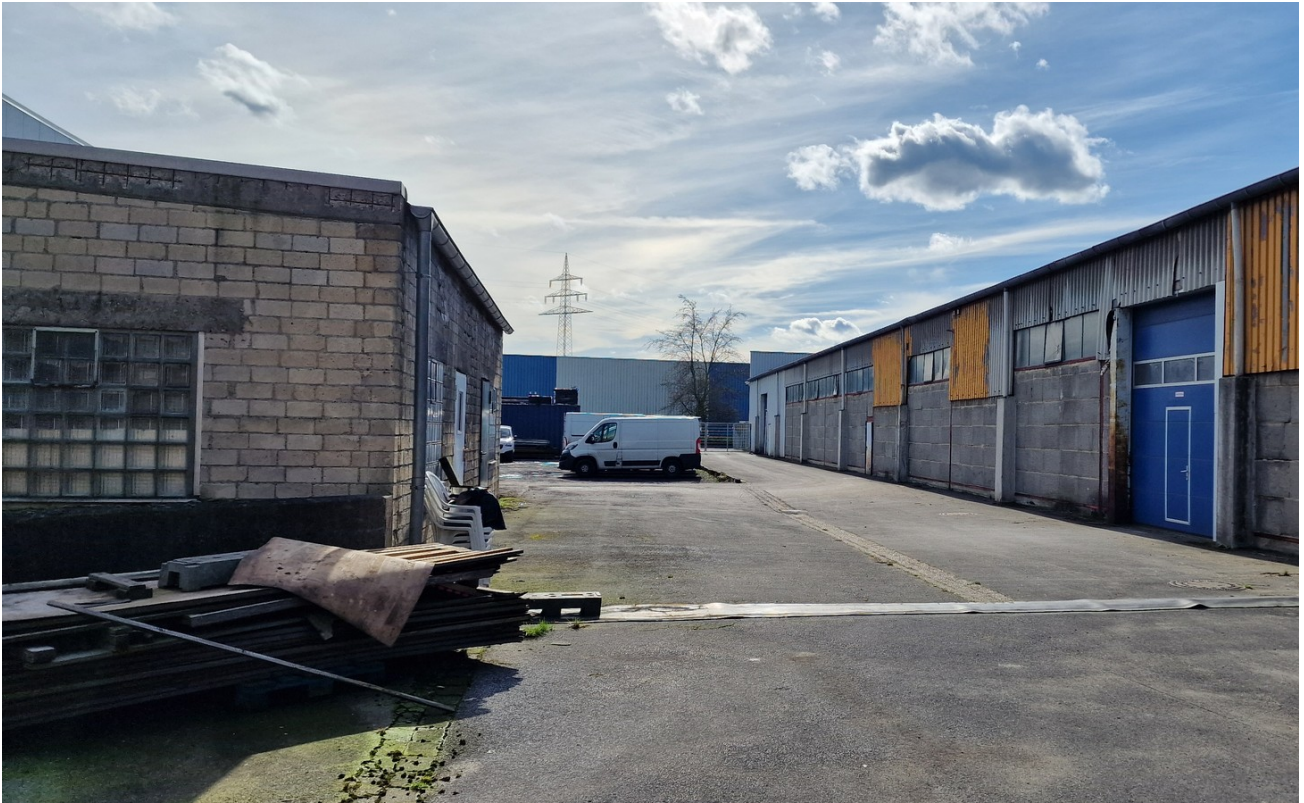
Halle B hintere Zufahrt