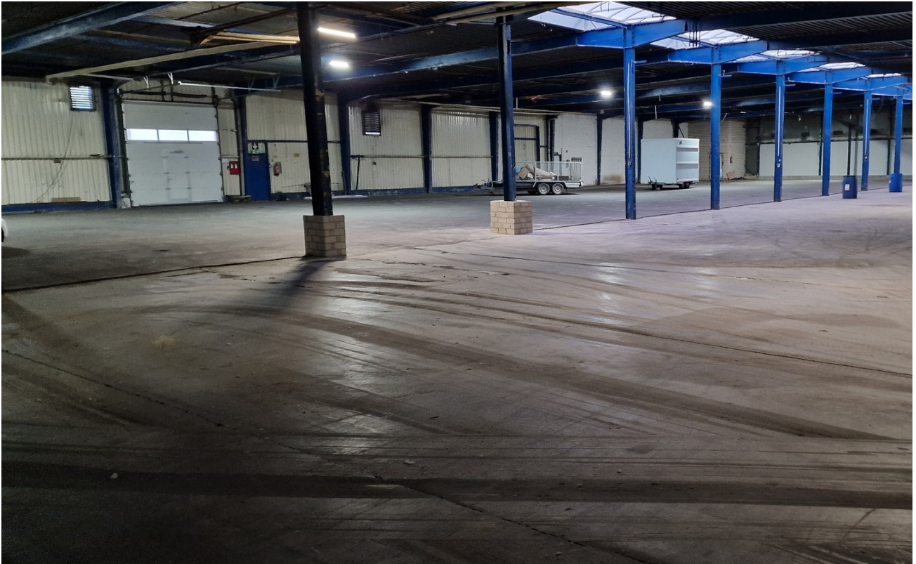
Halle A innen 2400qm 2