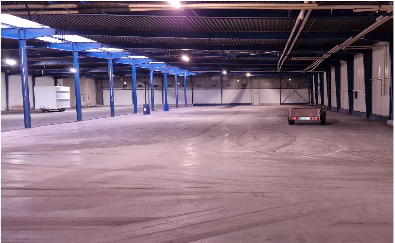
Halle A innen 2400qm 1