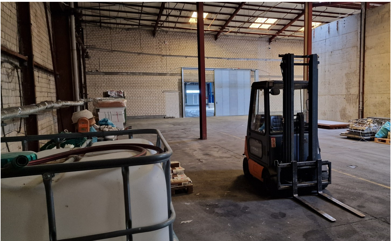
Halle B 2800 qm Innen 6