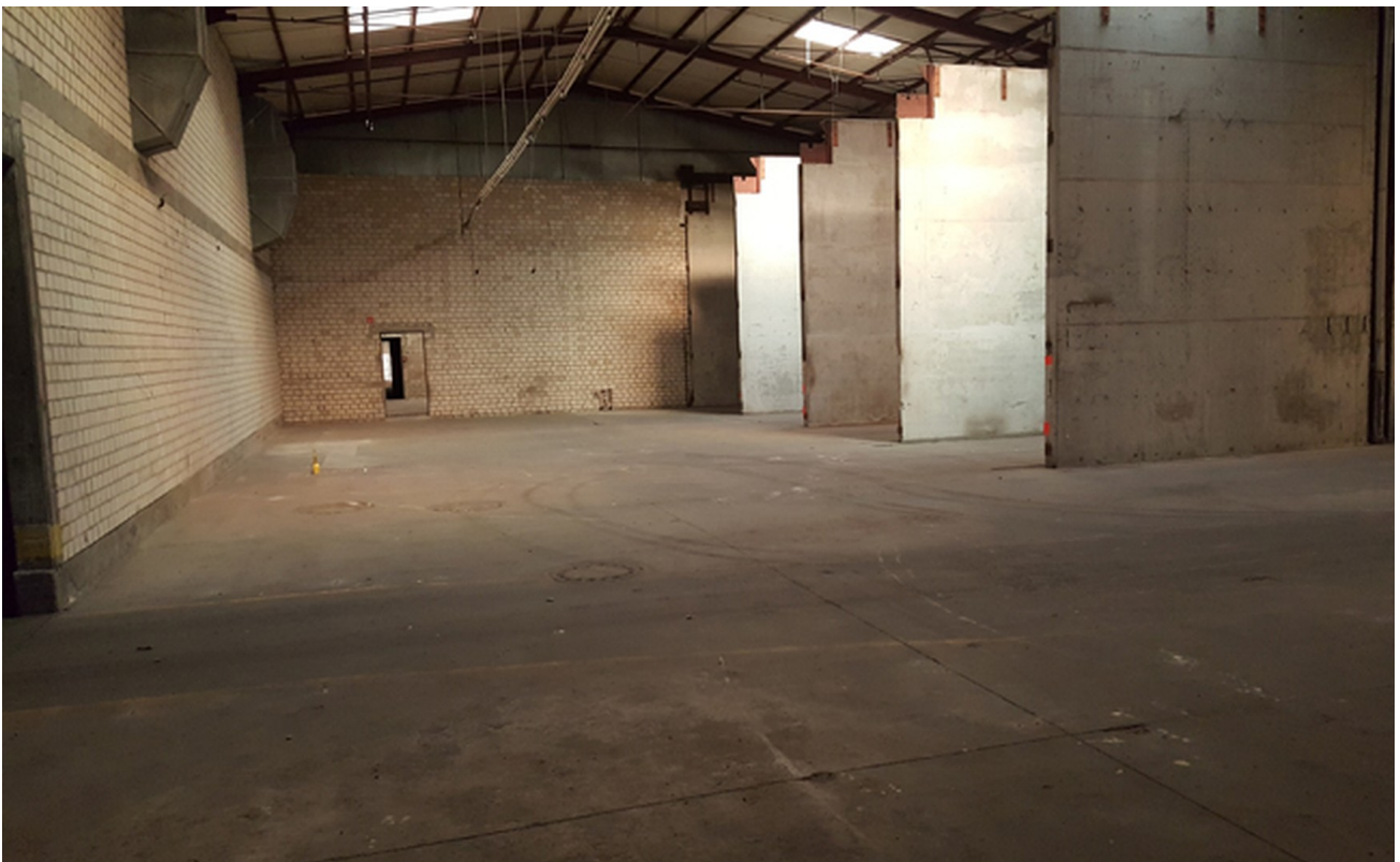
Halle B 2800 qm Innen 4