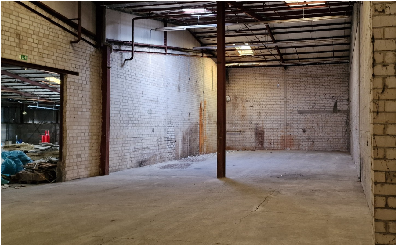
Halle B 2800 qm Innen 2