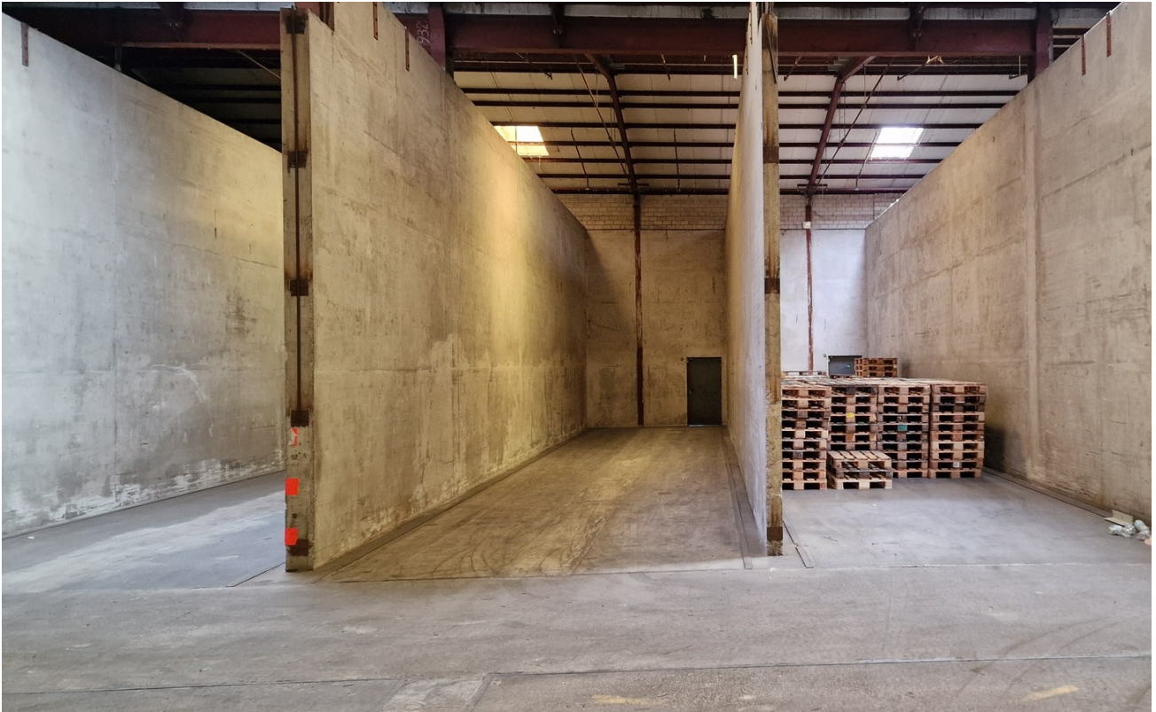
Halle B 2800 qm Innen 7