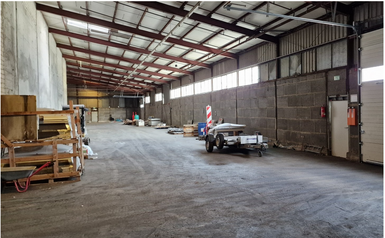
Halle B 2800 qm Innen