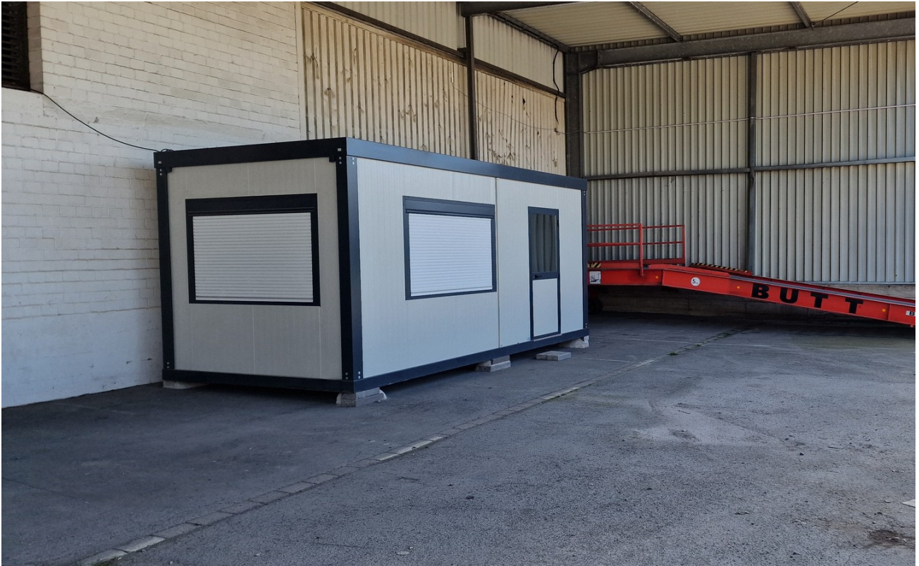
Halle A Bürocontainer Laderam