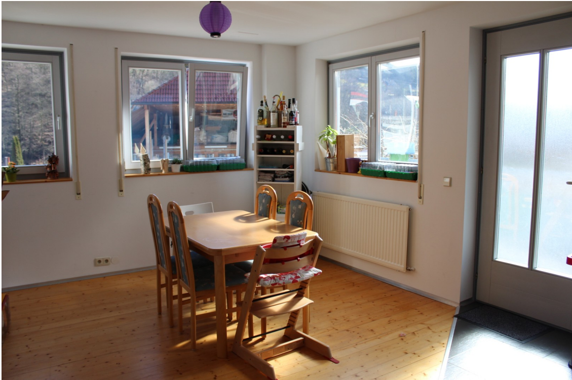
Küche / Essplatz