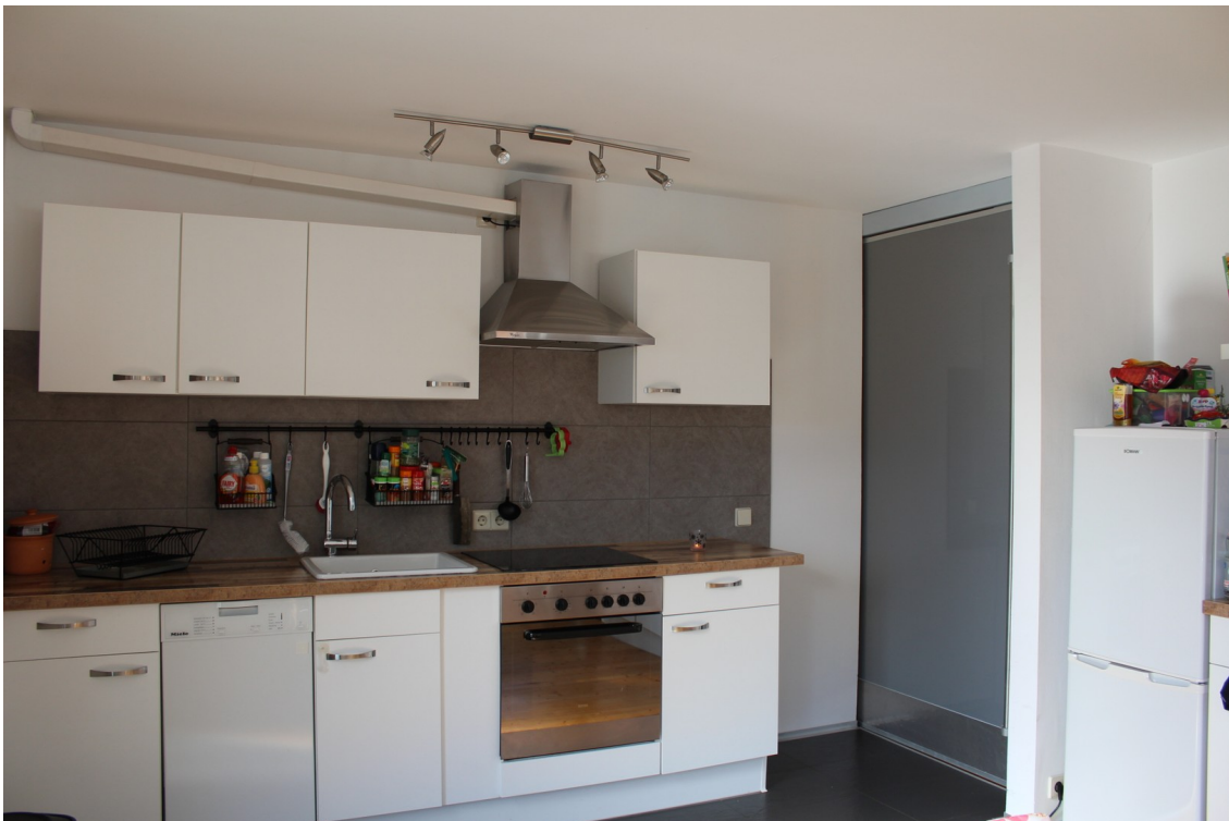
Küche, ohne Einbakküche!