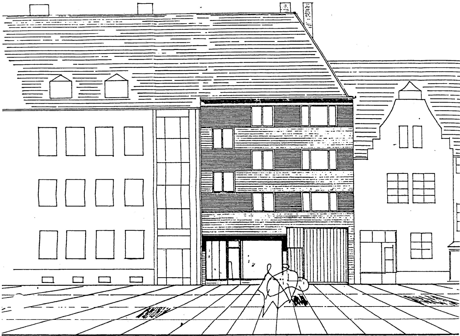
Straßen - Ansicht