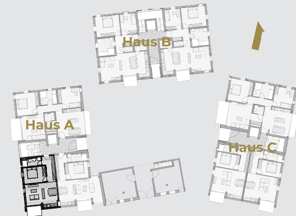
Erdgeschoss - Etagenansicht