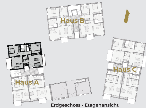
Erdgeschoss - Etagenansicht