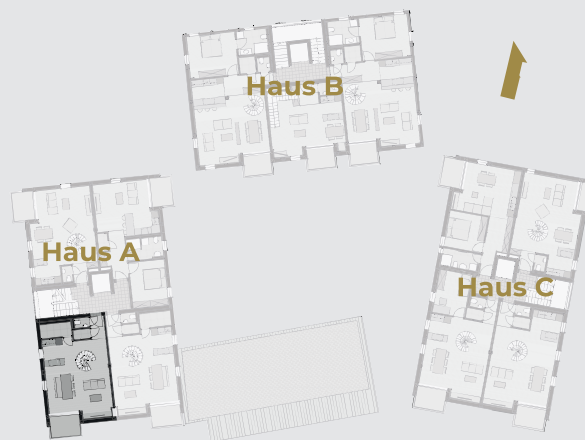
Zweites Obergeschoss - Etagenansicht