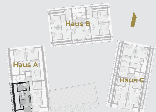
Dachgeschoss - Etagenansicht