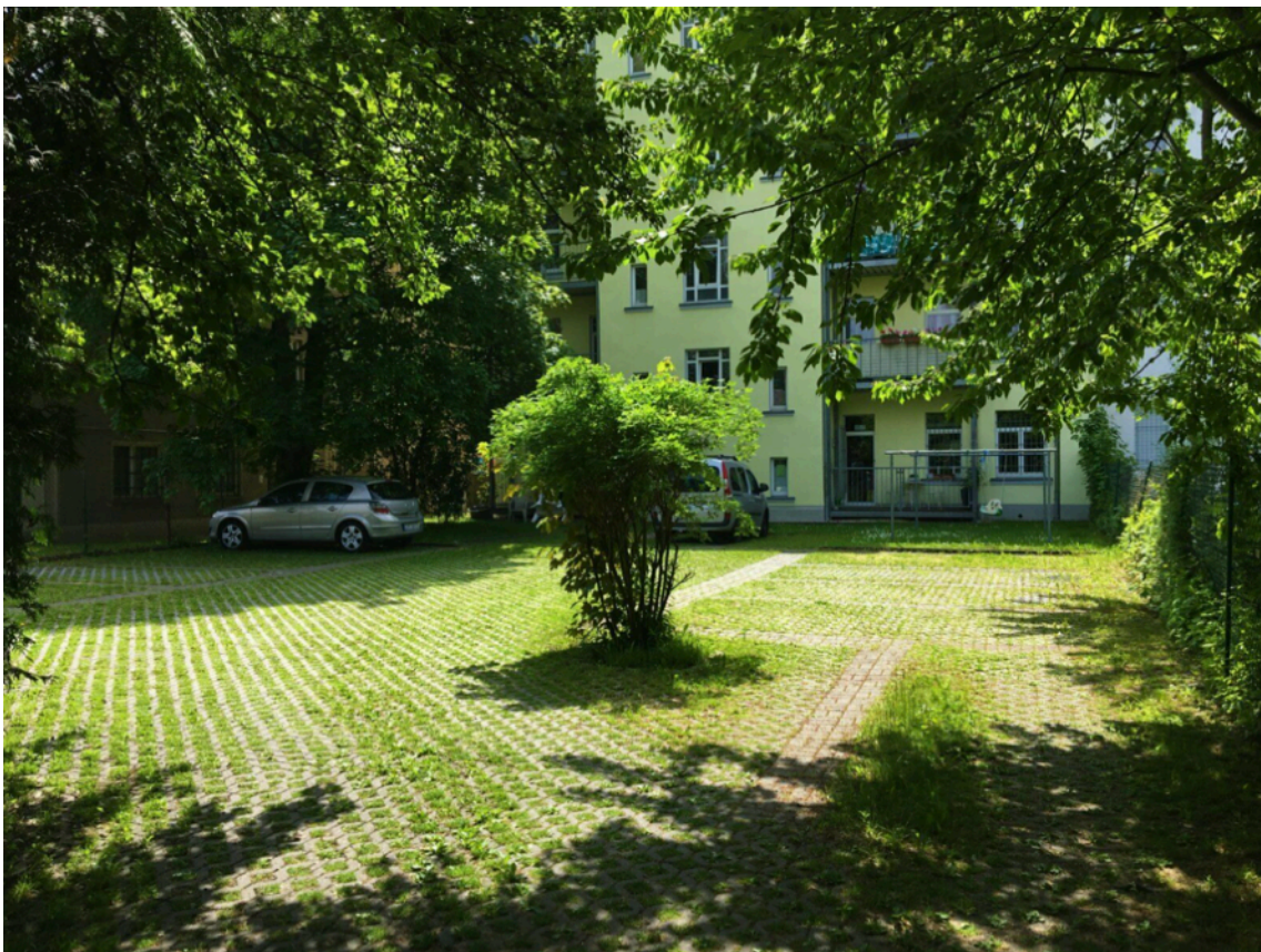
Ansicht Parkplätze im Hinterhof