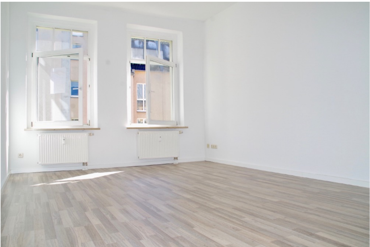
Schönes helles Wohnzimmer