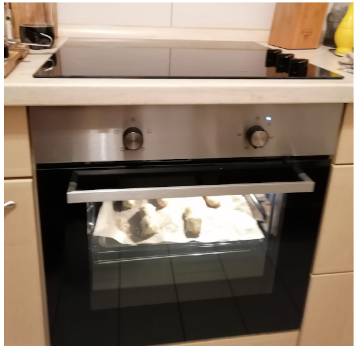
Neuer Ofen / Herd