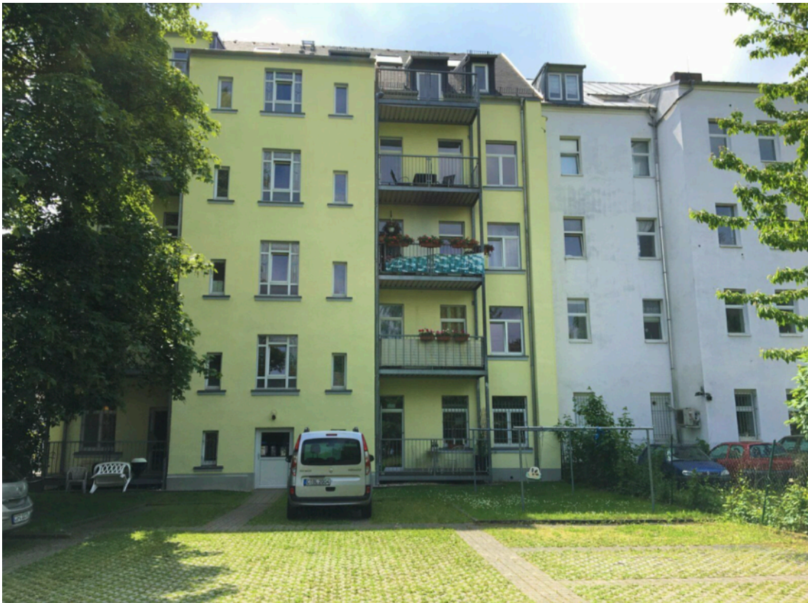
Ansicht Gebäude von hinten