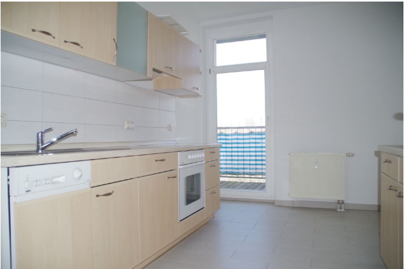
Einbauküche (Auf dem Foto sind noch die alten Geräte zu sehen)