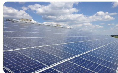
Photovoltaik 10,5 kW