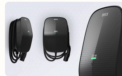
Wallbox 11 kW