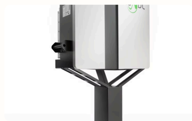
Speicher 13 kWh

Durch die hohe Energieeffizienz des Hauses können Sie Ihre Energiekosten deutlich reduzieren und gleichzeitig einen Beitrag zum Umweltschutz leisten.