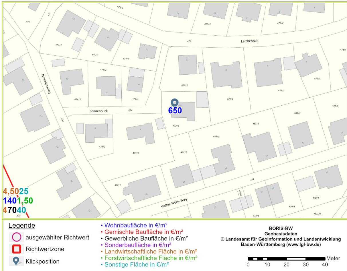
Abbildung 2: zentralisierte Darstellung der Klickposition mit den gewählten Einstellungen von Maßstab und Hintergrundkarte am Bildschirm

Der von Ihnen gewählte Bereich liegt in der Gemeinde/Stadt Remseck. Die Darstellung dieses Kartenbereichs kann durch den Anwender individuell beeinflusst werden, z.B. durch Ändern der Klickposition, des Zoommaßstabs oder der Auswahl der Hintergrundkarte.