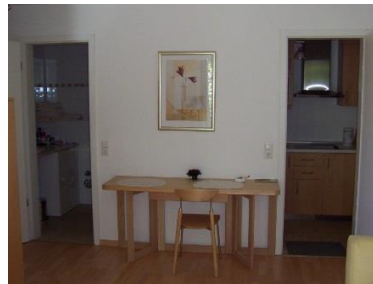
r.: Küche l.: Bad